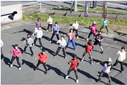
~ソーシャルディスタンスきれいに確保できました!!!~

何卒ご理解ご協力のほどよろしくお願い致します。上記以外でも安全に関する問題点など、気になる事がございましたら是非ご提案くださいませ。