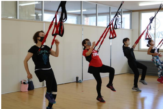
~Ready GoGoGoGo!! 走ります!!~